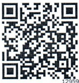
南宁会展豪生大酒店

会议统一安排用餐；会议往返交通费、住宿费自理。参会代表可以扫描以下二维码或小程序预定酒店。