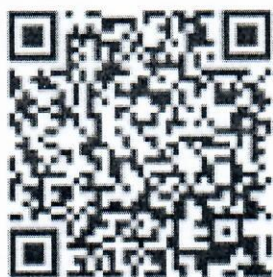
南宁会展雅斯菲尔酒店